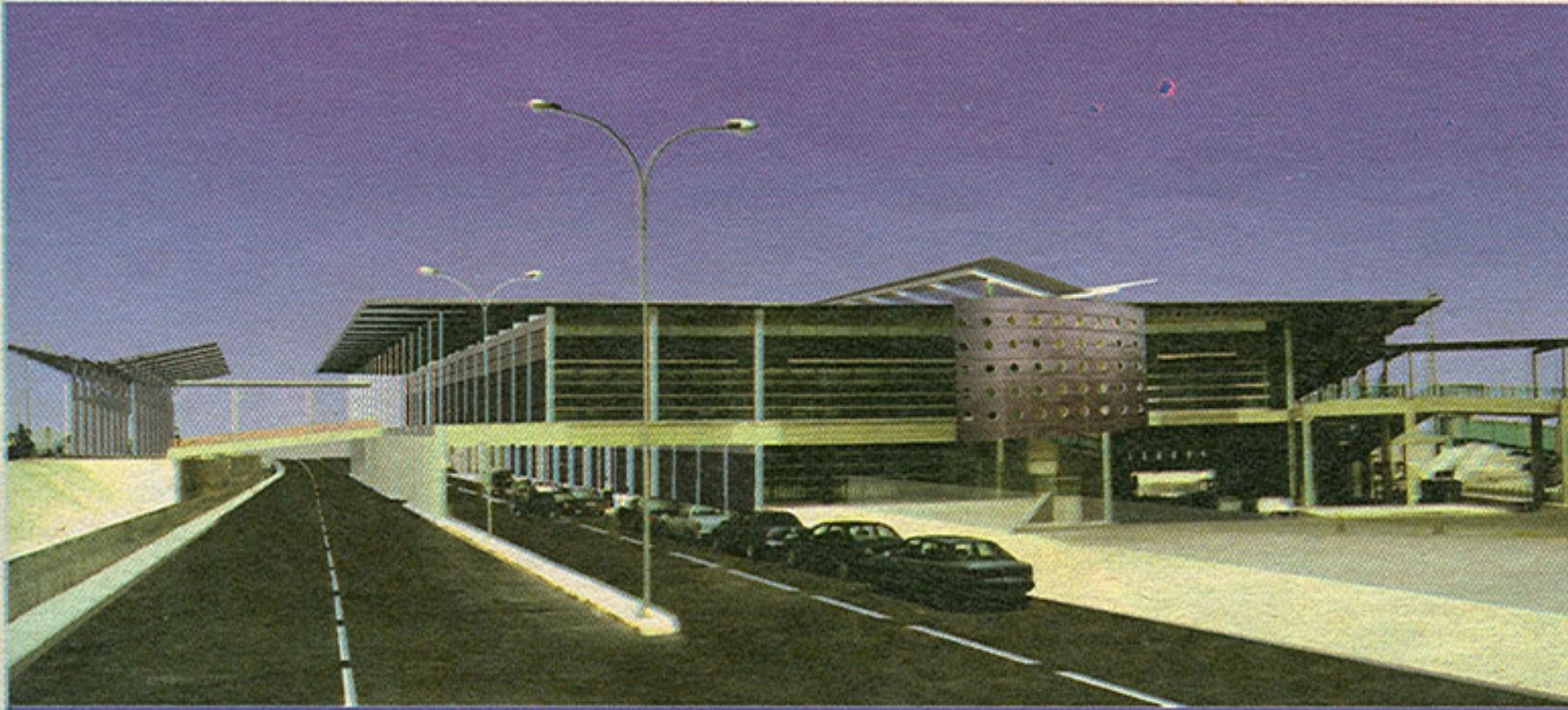
Aeropuerto en Chile diseñado para IATA en colaboración con el Arq. Hans Fisher