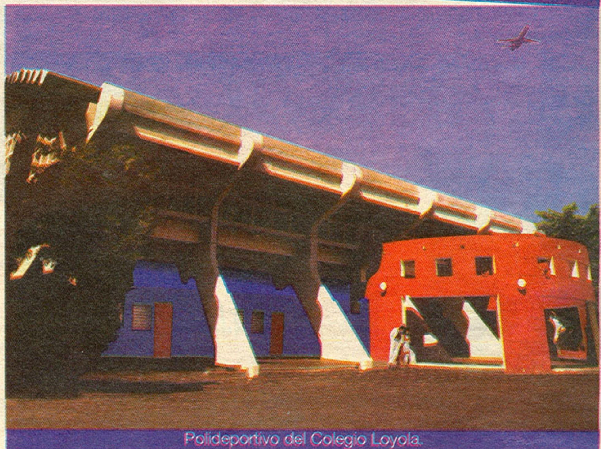
Polideportivo del Colegio Loyola.