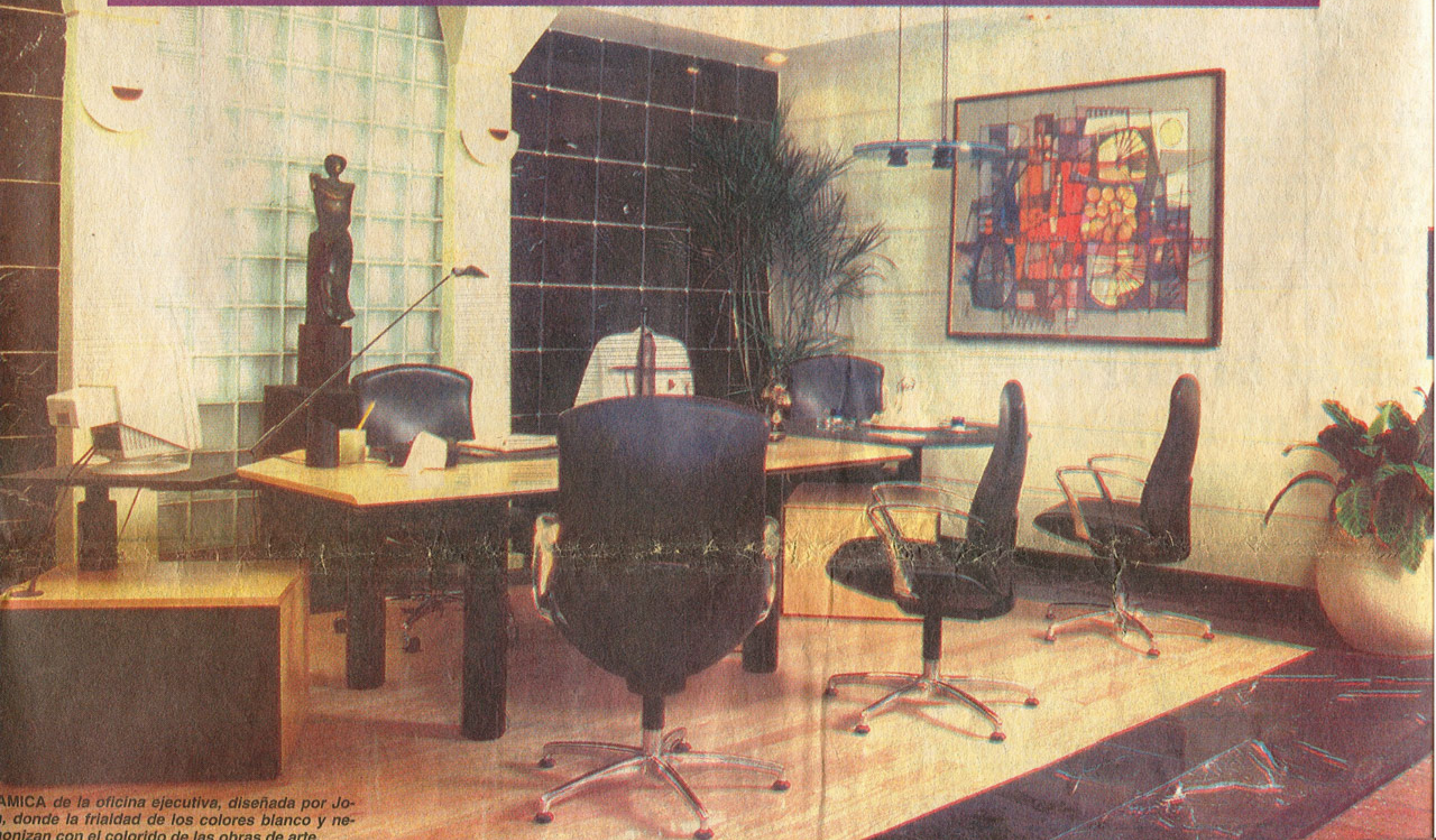
MICA de la oficina ejecutiva, diseñada por José Mella Febles, donde la frialdad de los colores blanco y negro se neutralizan con el colorido de las obras de arte.